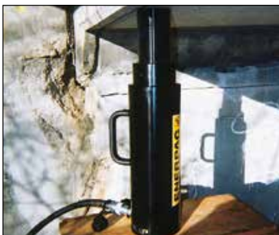
◀ Die tragbaren RACL1506 Zylinder mit Sicherungsmutter dienen zur langfristigen Lastaufnahme bei der Epoxideinspritzung im Rahmen der Brückenverstärkung.